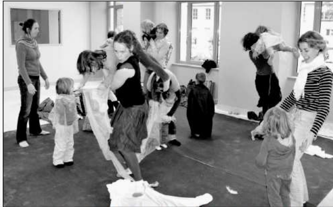
Journée nationale des assistantes maternelles à Aubusson... un métier qui s'est professionnalisé, avec des structures support partenaires d'institutions.

Les nounous sont devenues des assistantes maternelles. Ce changement de terminologie révèle une professionnalisation de ce corps de métier. Des formations sont organisées pour répondre au mieux à l'évolution des enfants dont elles ont la charge. Mais les parents ne doivent pas oublier qu'ils ont des obligations d'employeurs envers elles !