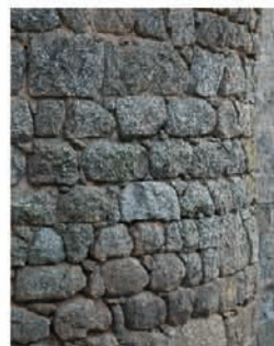
en maçonnerie assisée, chaque pierre correspond à un lit