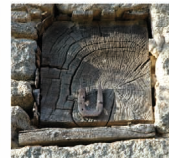
Symbolique dans la maison d'habitation : Linteau sculpté et poutre en bois ornée d'un fer à cheval