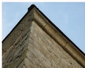
Corniche à doucine en forme de "S", signe de savoir-faire et de réussite sociale