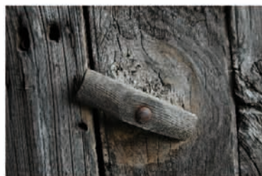
Système de fermeture d'un portillon

④ Tournez sur votre gauche pour un petit chemin rejoignant la route de Chamy. Arrivé au petit village, traversez-le en observateur attentif.