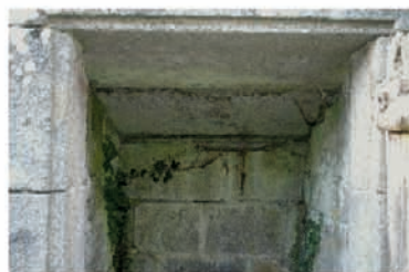
Puits en pierre de taille, couvert en dalles