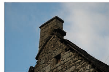
Souche de Cheminée